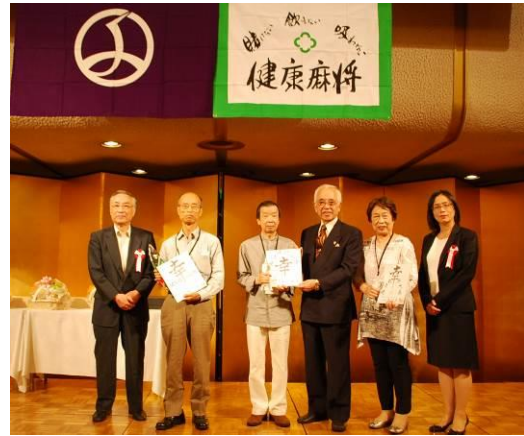
区民大会上位3名の皆さん