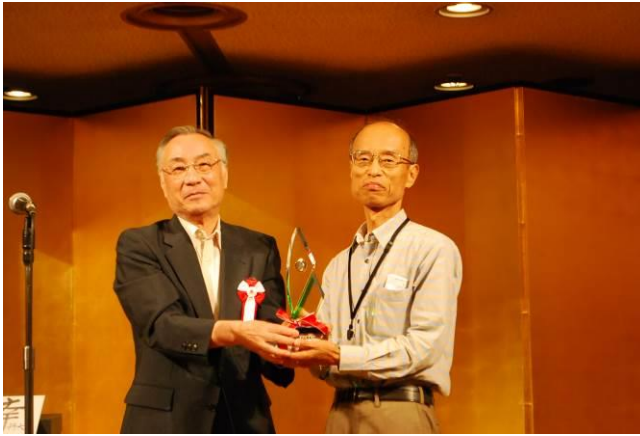
石川区長より区長杯を受け取る優勝者