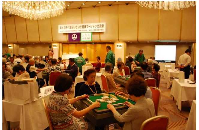
千代田区民健康マージャン大会（区長杯）の様