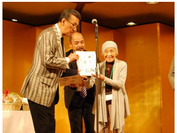
最高齢女性 97歳の素敵な笑顔