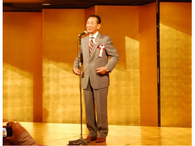
来賓挨拶 戸張 孝次郎 千代田区議会議員