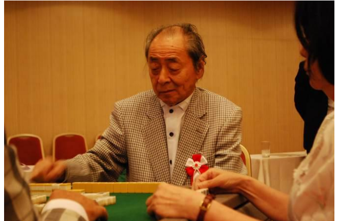
ゲスト 麻雀プロ 小島 武夫さん