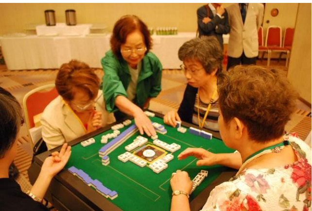
初心者もボランティアがやさしく指導