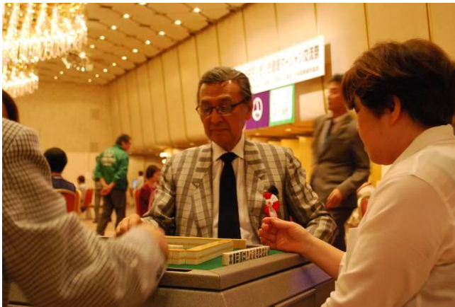
ゲスト 俳優 宝田 明さん