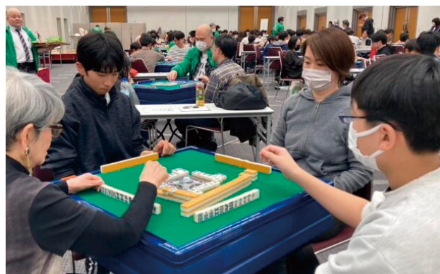
※家族ふれあい麻将大会からのイメージ画像です

毎年2期開講しているこの講座は、健康マージャン教室の講師を目指す方を対象に開講しておりますが、近年人気が高まってきており、今期は定員を超えるご応募をいただきました。