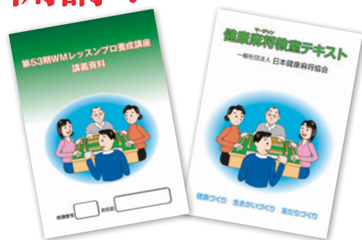
内容が充実した講義資料

今回受講することができなかったかたには、ぜひ次期12月13日（土）・14日（日）開講予定の第54期WMレッスンプロ養成講座をご受講いただきたくお願い申し上げます。