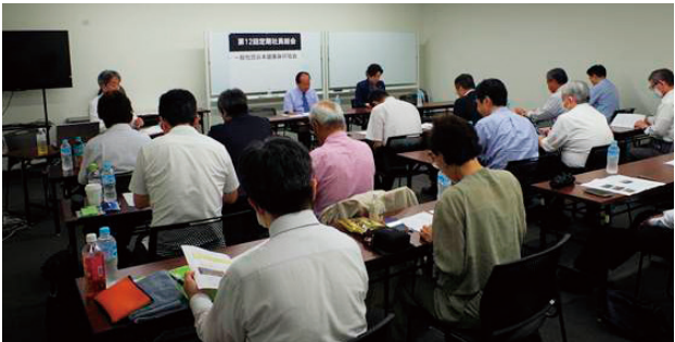
今回（第12回）の総会の模様

業計画ならびに予算案に全国の支部体制および事務局の人員を始めとした機能の強化、さらなる協働案件の検討・実施も盛り込まれています。 すでに市民権を得た頭脳スポーツとして、一部イベントでは「賭けない・飲まない・吸わない」の枕詞を外すものも出てくるなど、ますますの広がりを見せている健康マージャン。来年度の協会のさらなる施策、活動にもご注目ください。