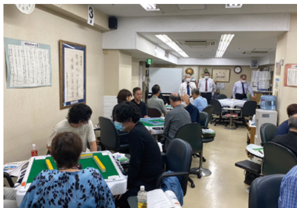
実際に卓についての講義