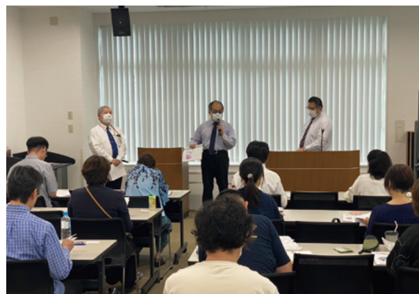
経験豊富な講師陣