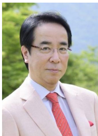
最高位戦日本プロ麻雀協会 土田 浩翔プロ

健康麻将全国大会としては初のゲストプロを招いての開催となっております。 現在活躍中のマージャンプロと一緒にマージャンが打てる貴重な体験！当日を楽しみにお待ちしております！！