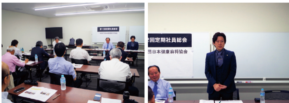
会場は昨年同様銀洋ビル地下一階会議室

なお、総会終了後、会員の皆さんとの懇親会を開催いたします。会員の皆さまと楽しい時間を過ごすことができれば幸いです。